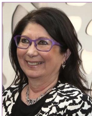
Vice-présidente du GART déléguée Accessibilité