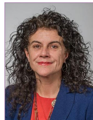
Vice-présidente du GART déléguée Transition énergétique

Syndicat mixte des transports en commun de l'agglomération Clermontoise Président