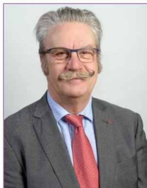
Vice-président du GART délégué Gouvernance des mobilités