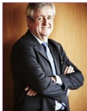
Deuxième vice-président du GART délégué Financement & Tarification