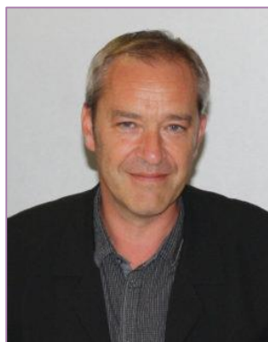
Vice-président du GART délégué Innovation technologique

Île-de-France Mobilités Premier vice-président