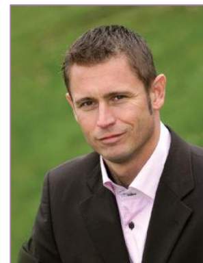
Vice-président du GART délégué Île-de-France

Région Bourgogne-Franche-Comté Premier vice-président