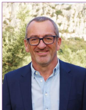
Vice-président du GART délégué Sécurité & Sûreté