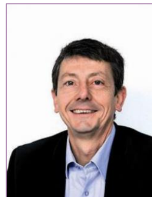
Vice-président du GART délégué Stationnement

Métropole Aix-Marseille-Provence Vice-président transports, mobilité durable