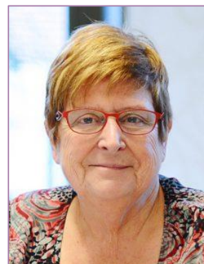
Vice-présidente du GART déléguée Coopération internationale

Orléans Métropole Vice-président grands équipements, connexions métropolitaines et parkings en ouvrage