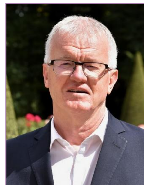
Vice-président du GART délégué Club des partenaires

Metz Métropole Conseillère métropolitaine